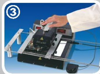
3 El tomado por vacio en el reflow