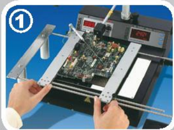
1 PCB en soporte y componente ambos debajo de laser