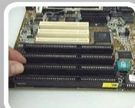
Retiro de sockets VGA