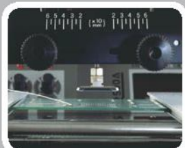
Retiro e instalacion de BGA