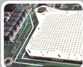
Retiro de sockets plasticos Intel