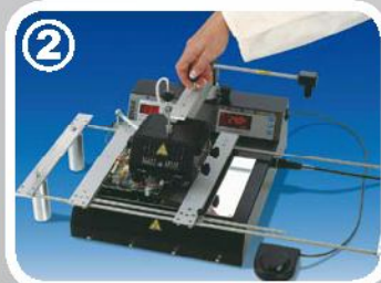
2 Calefactor superior en posicion baja para reflow