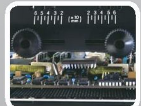
Retiro de PGA de pines en tarjeta perforada

*Oferta válida hasta el 31/12/09, o hasta agotar Stock.